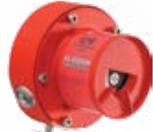
Détecteur de flamme infrarouge multi-spectres