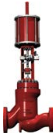
Conditions de service difficiles (anti-cavitation V-LOG)