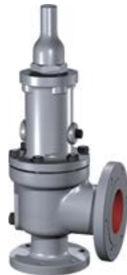
Soupapes de sécurité et de décharge