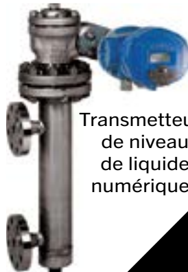
Transmetteurs de niveau de liquide numériques