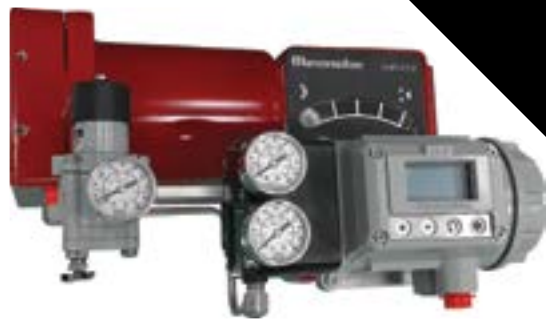
Vannes de contrôle rotatives Camflex / Positionneurs de vannes intelligents SVI3