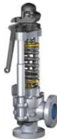
Soupapes de sécurité