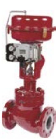
Vannes de type globe à cage