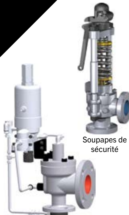
Soupapes de décharge de sécurité pilotées

Des soupapes à ressort aux soupapes pilotées, chaque soupape de décharge de pression est configurée pour offrir un contrôle sûr et efficace dans des applications de surpression difficiles.