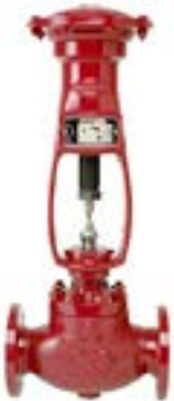
Régulateurs de pression