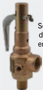
Soupapes de sûreté en bronze

Soupapes de sûreté et de décharge de sécurité conformes aux sections I, IV et VIII de l'ASME. Disponibles en laiton, bronze, fonte, acier carbone et acier inoxydable. Elles sont proposées avec des tailles d'entrée allant de 1/4" à 6". Ces soupapes sont certifiées pour les services de vapeur, d'air/gaz et de liquide, avec des pressions de tarage allant jusqu'à 900 psi.