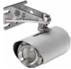
Détecteur de gaz laser Senscient ELDS