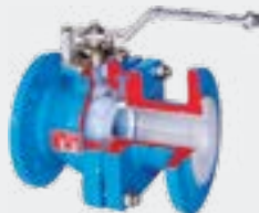
Robinetts à tournant sphérique revêtu