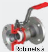
Robinetts à tournant sphérique