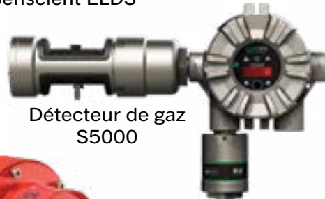
Détecteur de gaz S5000