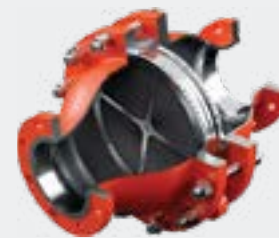
Arrête-flammes anti-déflagration en ligne