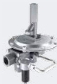
Soupapes d'isolement de réservoir pilotées