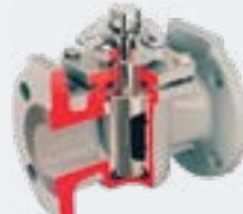
Robinetts à boisseau