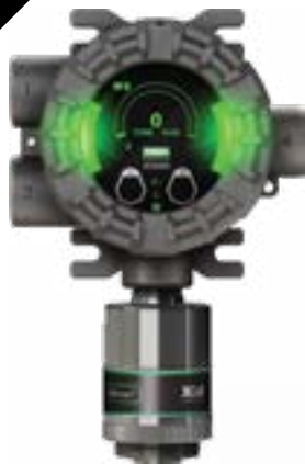
Détecteur de gaz ULTIMA X5000